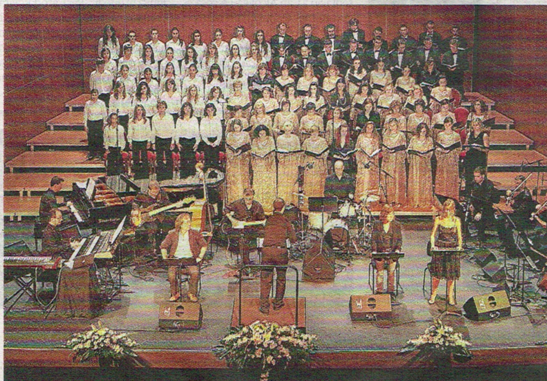
La cantata s'estrenà el 2006 al Principal. Ara es torna a representar perquè la situació no ha canviat gens.